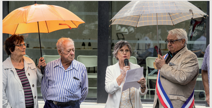
Le centre multi-culturel René-Pont a été inauguré à Quillan en août 2019, un atout majeur pour la vie culturelle de la cité des Trois Quilles.