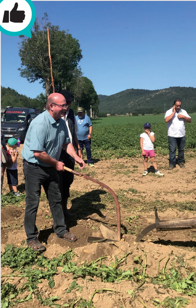
Chaque année, on fête la pomme de terre du Pays de Sault à la fin du mois d'août à Espezel.