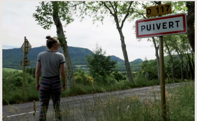
Les Zombies chez nous, tel est l'intitulé du projet des jeunes de la MJC de Puivert qui a obtenu un financement de 2000 € du conseil départemental des jeunes de l'Aude. Un jeu pédagogique grandeur nature autour de l'écologie et du patrimoine.