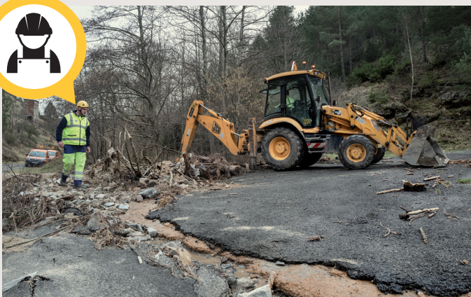
Les agents du Département se sont rapidement mis au travail pour sécuriser les routes abîmées par le passage de la tempête Gloria dans la Haute-Vallée.